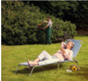
Dienstleistungen und Garten