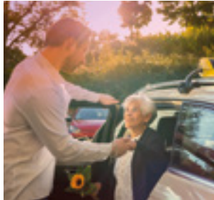
Lieferung und Mobilität